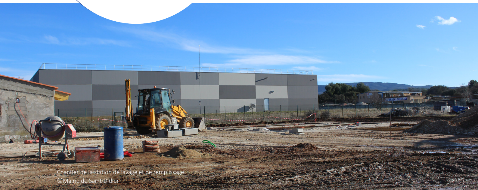
Chantier de la station de lavage et de remplissage