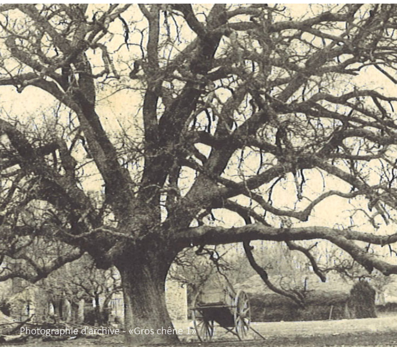
Photographie d'archive - «Gros chêne 1»