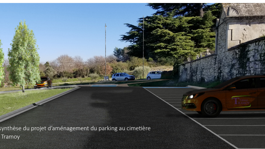
synthèse du projet d'aménagement du parking au cimetière Tramoy

Les véhicules débouchant de la Sérignane avaient tendance à accélérer dans la montée, alors même qu'ils pénétraient dans une zone à 20 km/h à proximité du groupe scolaire et de la clinique.