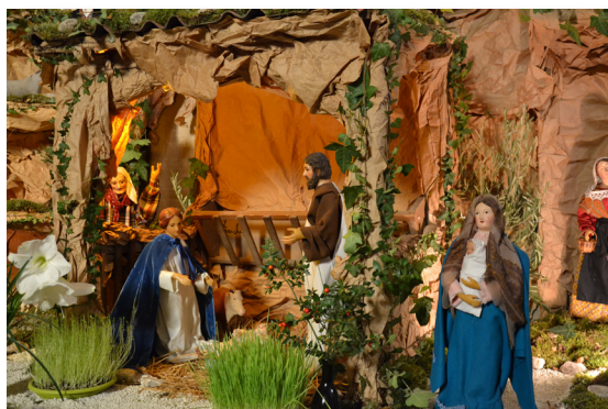
Crèche de l'église paroissiale, réalisée par Raymond Cornutello, Gérard Marquet, Jean-Pierre Mirada, Marcel Teste et Francis Berger.