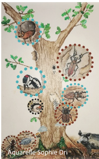
Aquarelle Sophie Dri

ne sont pas que les riverains, les promeneurs, les sportifs, qui seraient alors en peine de repère et de mémoire, mais toute une multitude d'êtres vivants qui se verrait condamnée à disparaître ! Car quelle que soit la saison, le bois mort de son large tronc sert de refuge et de garde-manger à de nombreuses espèces vivantes d'insectes, d'oiseaux, de champignons et de mousses.