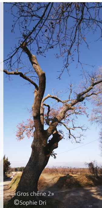
«Gros chêne 2»

http://bit.ly/35xrR30 http://bit.ly/35x0Htj https://bit.ly/3oiHTyY https://bit.ly/2Xzf19G http://bit.ly/38xLdah