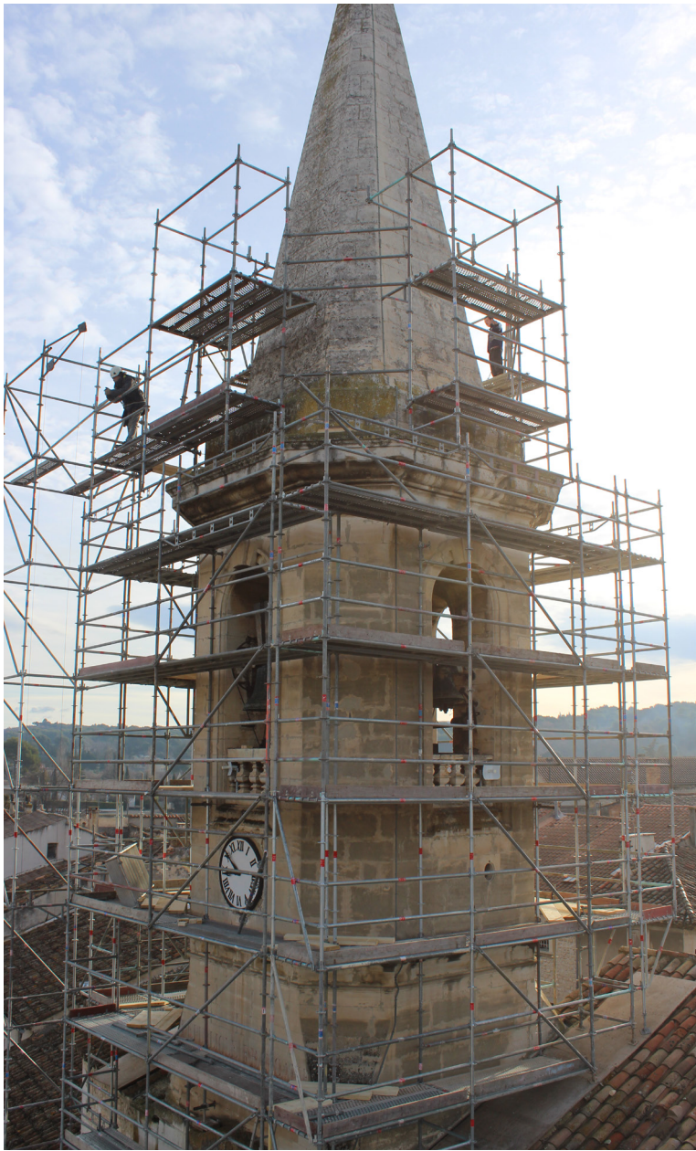
Installation de l'échafaudage du clocher